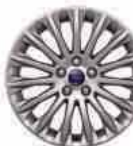
17" kola z lehkých slitin D2YL5 s 15 paprsky (výbava na přání a příslušenství) Číslo dílu 1719527