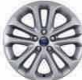
17" kola z lehkých slitin s 5x2 paprsky (příslušenství) Číslo dílu 1710606