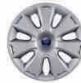
16" ocelová kola s kryty kol se 7 paprsky (standardní výbava pro Trend)