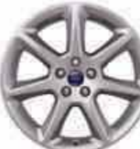
18" kola z lehkých slitin se 7 paprsky (příslušenství) Číslo dílu 1702126

Na snímku na protější straně je vůz Ford Focus Titanium v metalické barvě červená Candy (výbava na přání) a 18" koly z lehkých slitin s 5 paprsky (výbava na přání a příslušenství).