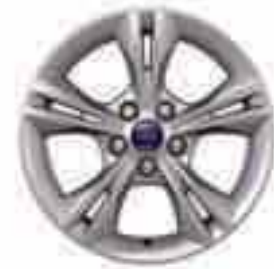
16" kola z lehkých slitin s 5x2 paprsky (příslušenství) Číslo dílu 1715341