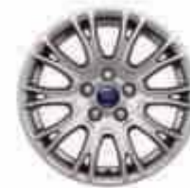
16" kola z lehkých slitin D2XBS s 10 paprsky "Y" (standard pro Titanium a příslušenství) Číslo dílu 1715343