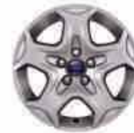
16" ocelová kola "Design" s kryty kol s 5 paprsky (výbava na přání pro Trend)