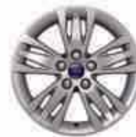
16" kola z lehkých slitin D2XD6 s 5x3 paprsky (výbava na přání a příslušenství) Číslo dílu 1715342