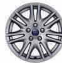
16" kola z lehkých slitin se 7x2 paprsky (příslušenství) Číslo dílu 1710604