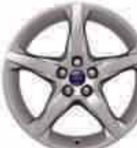
18" kola z lehkých slitin D2UD5 s 5 paprsky (výbava na přání a příslušenství) Číslo dílu 1719526